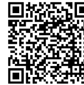
QR-Code der Anmeldeseite