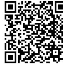
QR-Code der Anmeldeseite