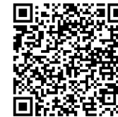
QR-Code der Anmeldeseite

mit dem PKW: Falls Sie ein Navigationsgerät benutzen, geben Sie bitte als Ziel die Jakob-von-Gundling-Str. 6 ein. Dort befindet sich die Einfahrt zum Parkplatz der LÄKB und weitere Parkmöglichkeiten in der Umgebung.